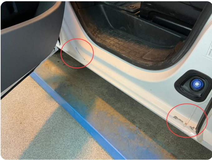
2.1 Øvrige feil Slitt lakk i alle dør åpninger der pakning gnisser mot lakk.