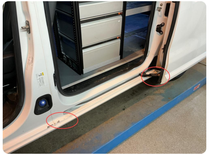
2.1 Øvrige feil Slitt lakk i alle dør åpninger der pakning gnisser mot lakk.