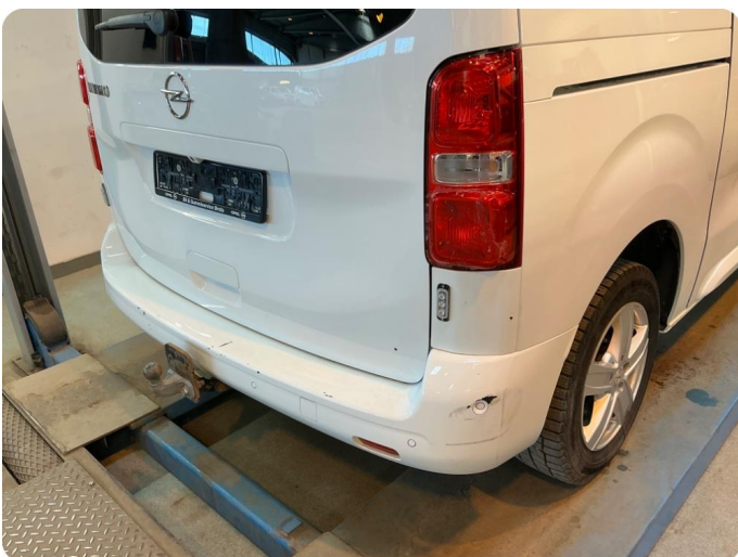
2.4 Ripe(r) Riper/ hakk/ små skader.