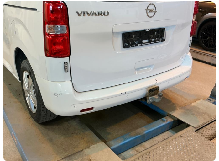
2.4 Ripe(r) Riper/ hakk/ små skader.