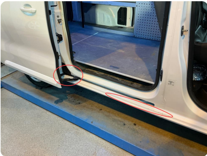
2.1 Øvrige feil Slitt lakk i alle dør åpninger der pakning gnisser mot lakk.