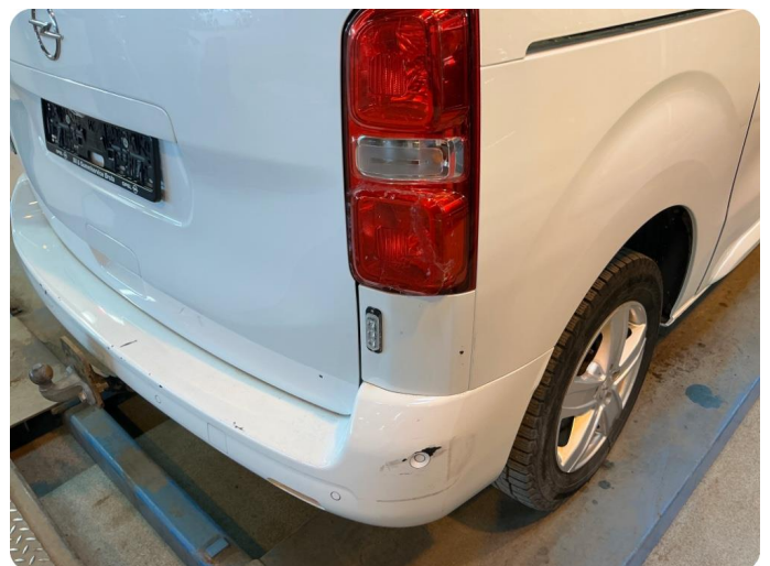
3.1 Defekt / sprukket glass Knust.