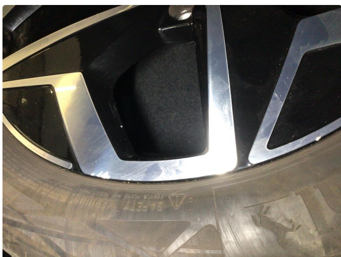
1.1 Kantkjørt en vinterfelg og to sommerfelger