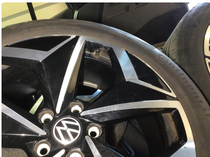
1.1 Kantkjørt en vinterfelg og to sommerfelger