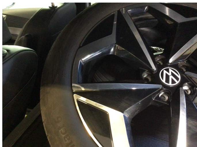
1.1 Kantkjørt en vinterfelg og to sommerfelger