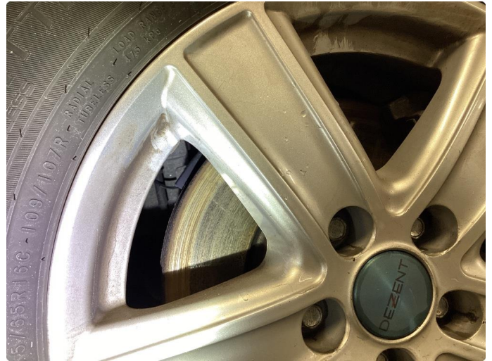
1.1 Rust. KJØRES RENE NÅR BILEN TAS I BRUK.