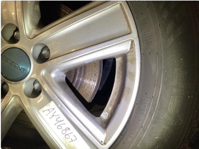
1.1 Rust. KJØRES RENE NÅR BILEN TAS I BRUK.