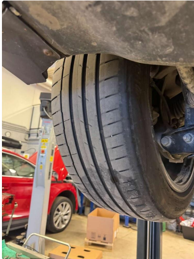
1.1 Skjev slitasje på sommerdekk, blir byttet før salg