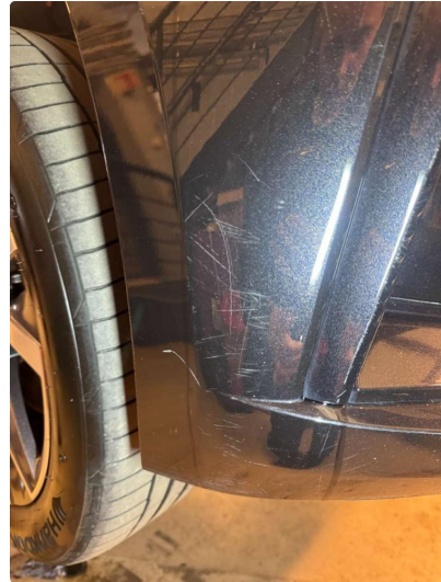
1.2 Liten skrape