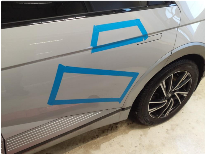
1.1 Flere bulker