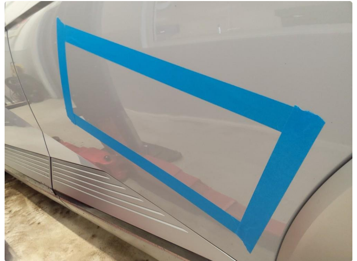
1.1 Flere bulker