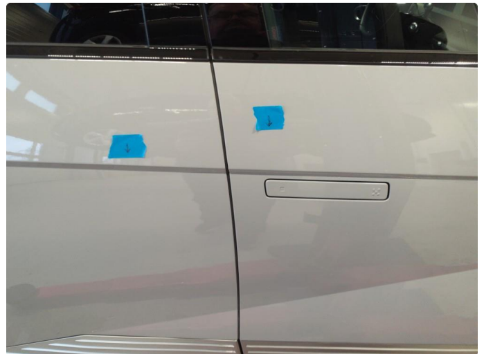
1.2 Flere p-bulker