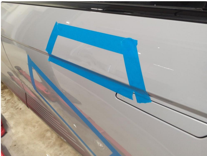
1.1 Flere bulker