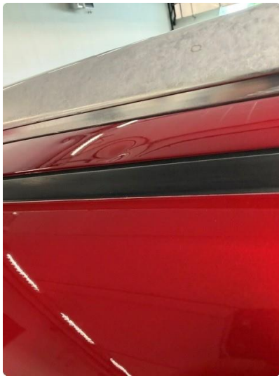
1.6 Bulk uten lakkskade