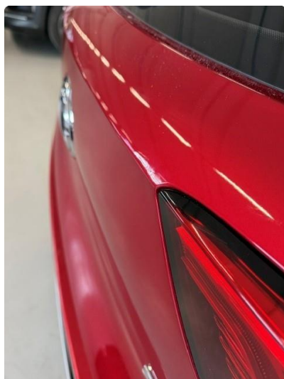
1.2 Små bulker