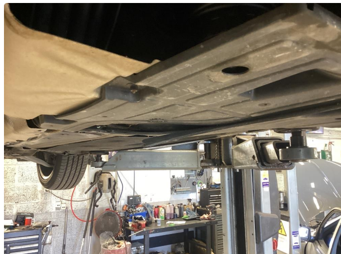
1.1 Beskyttelsesplate skadet/mangler