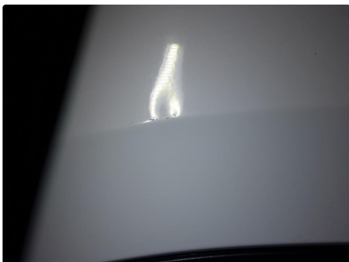
1.3 Liten bulk. Blir forsøkt med bulkfix.