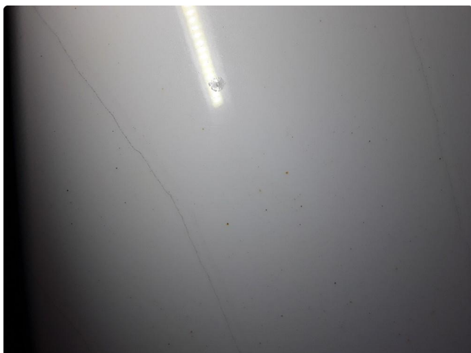
1.2 Liten steinsprut med korrosjon.