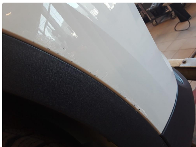
1.4 Noen riper.