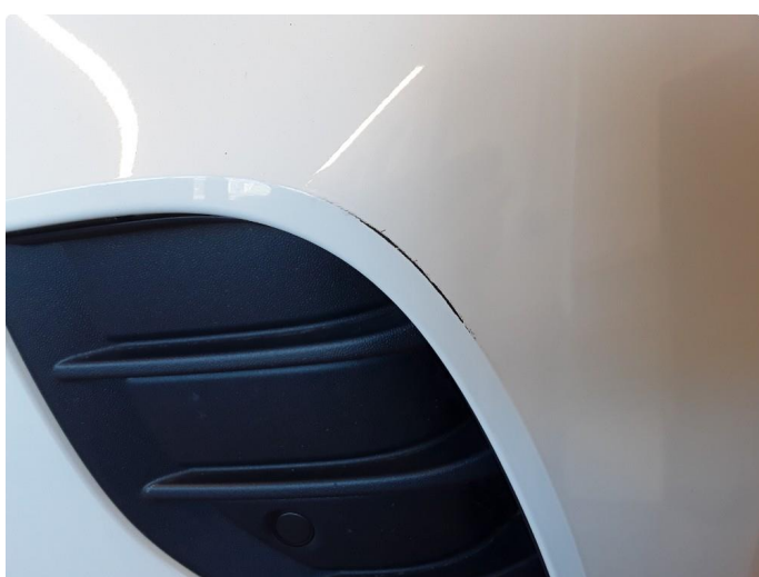
1.4 Noen riper.