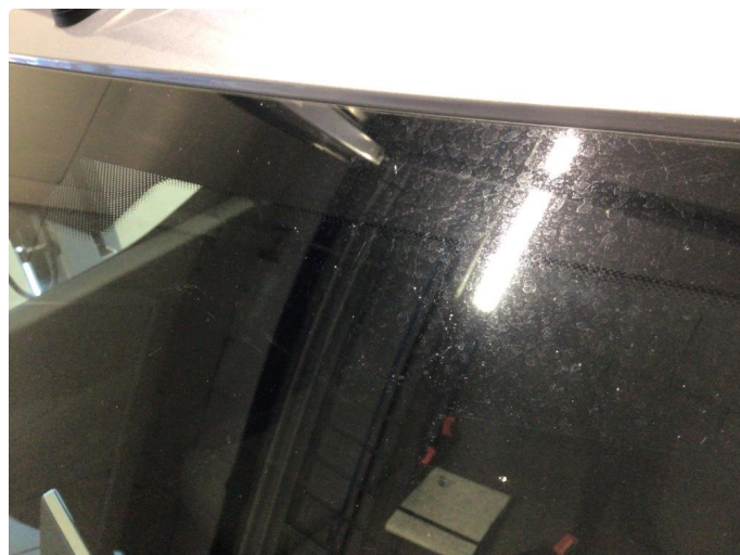
1.1 Noe slitasjeriper og steinsprut på frontvindu