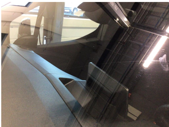
1.1 Noe slitasjeriper og steinsprut på frontvindu