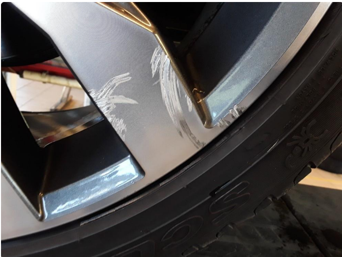
1.4 Noe kantkjørt sommerfelg.