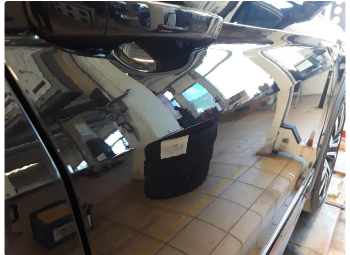
1.3 Liten bulk. Blir forsøkt med bulkfix.