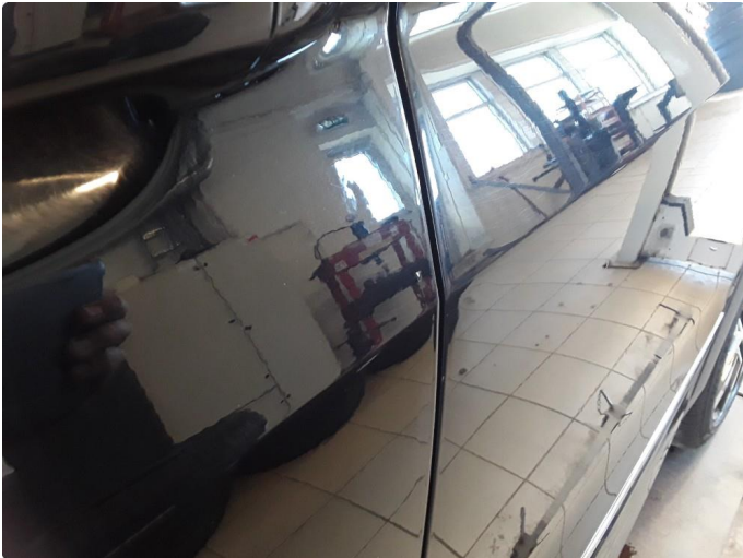
1.2 Liten bulk. Blir forsøkt med bulkfix.