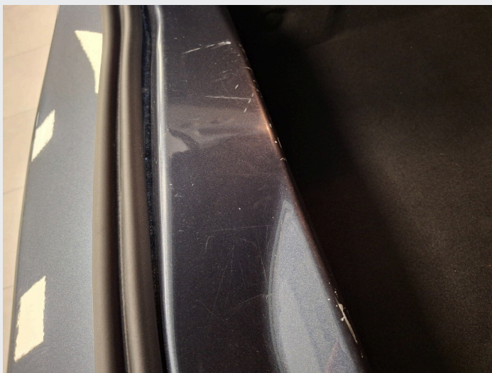
2.5 Riper innvendig døråpning bagasjerom