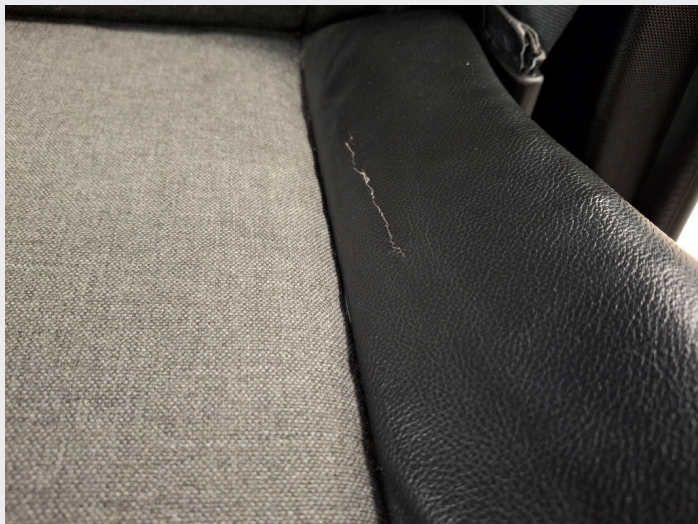
4.5 Sprukket skinn førersetet