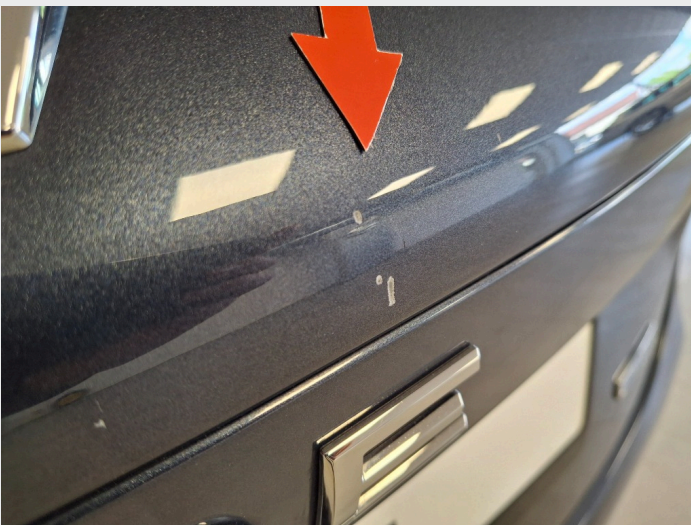
2.5 Merker/sår bakluke