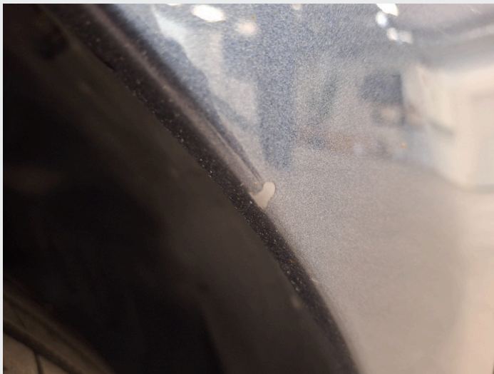
2.7 Merke/sår skjerm v.s.f