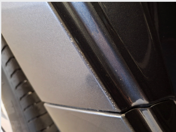
2.5 Merker/sår døråpning/skjerm h.s.b