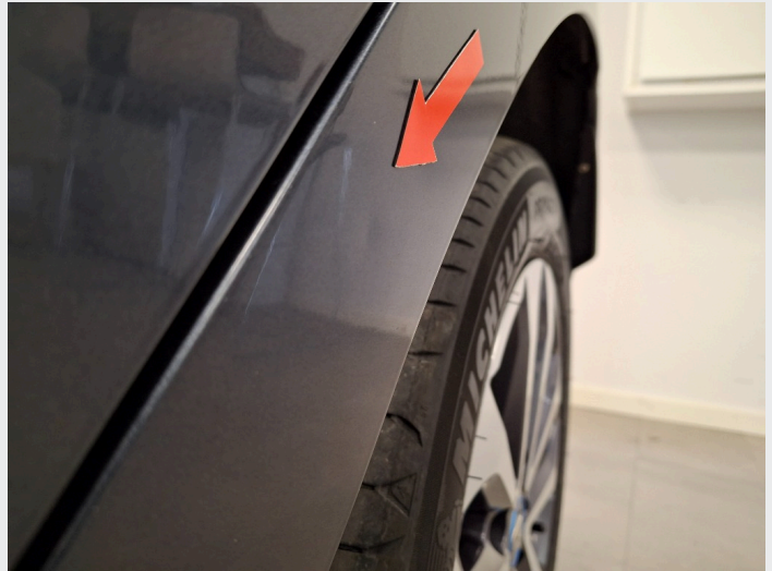
2.7 Liten bulk venstre bakskjerm