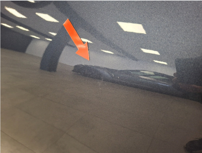
2.5 Noen merker på dør v.s.f