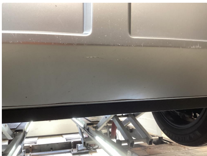
1.5 Skrubbskader underkant