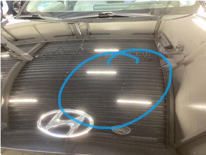
1.1 Mye stensprut