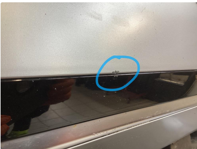
1.3 Løse/skadede lister