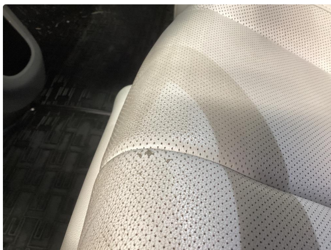
2.1 Skade på setepute