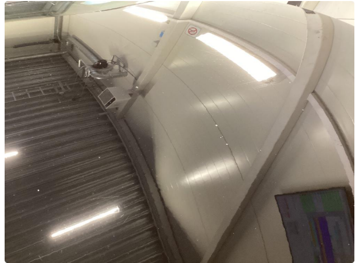
1.1 Mye stensprut