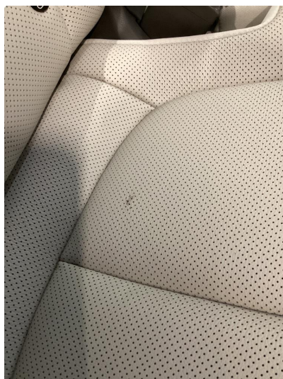
2.1 Skade på setepute