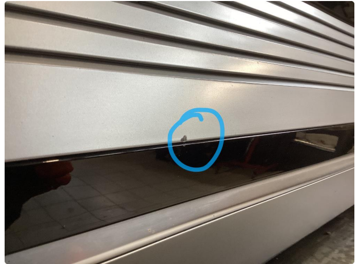
1.3 Løse/skadede lister