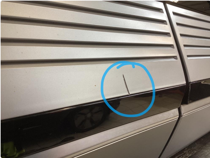
1.2 Løse/skadede lister