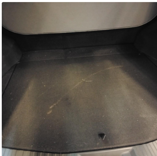
1.1 Mangler bagasjeromsmatte