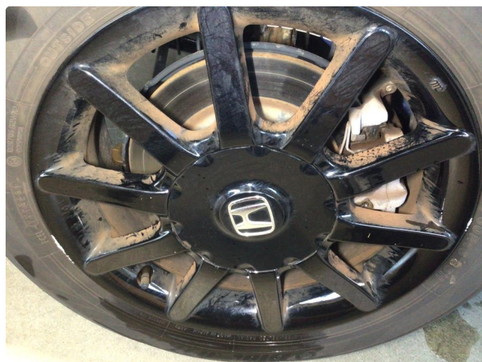
1.1 Kantkjørt tre sommerfelger og to vinterfelger