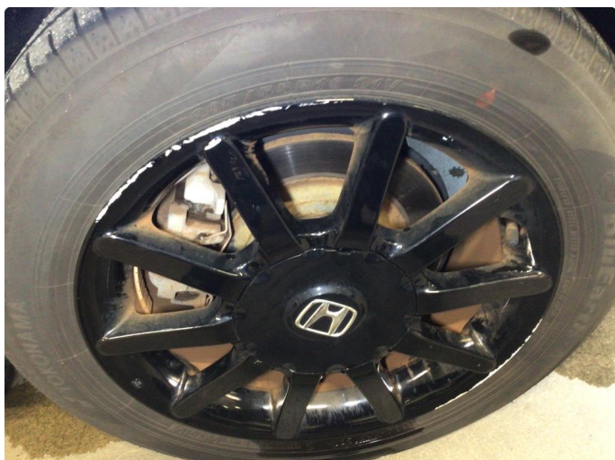
1.1 Kantkjørt tre sommerfelger og to vinterfelger