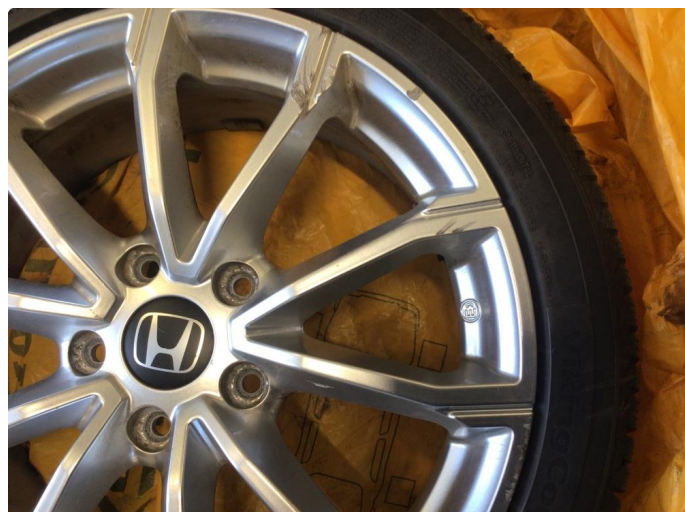
1.1 Kantkjørt tre sommerfelger og to vinterfelger