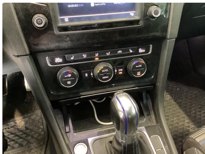
3.2 Svak/uteblitt funksjon på AC