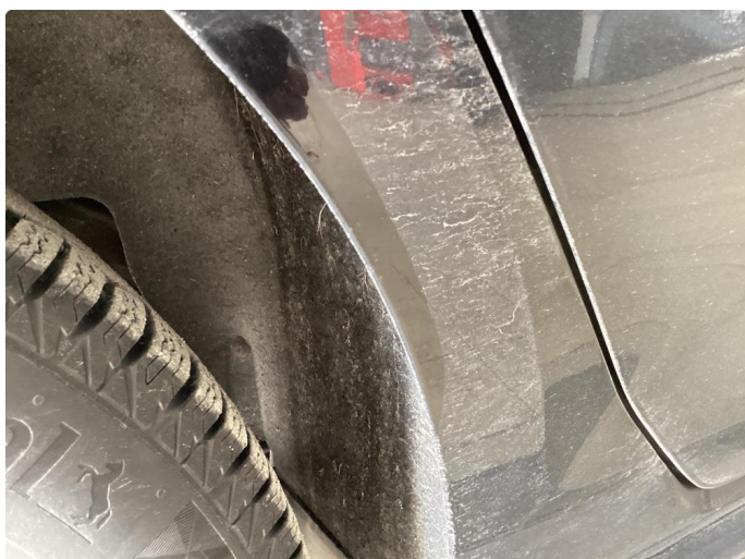
1.2 Noen små rust bobler