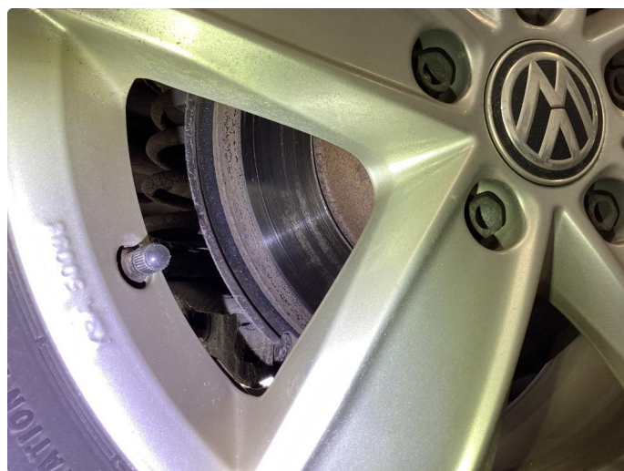
2.1 Slitte/stor slitekant