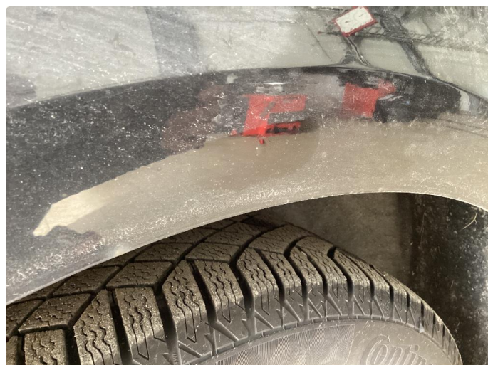
1.2 Noen små rust bobler