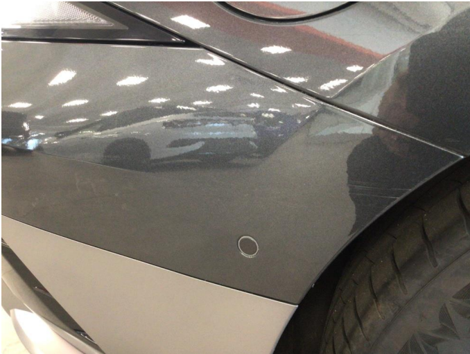
2.1 Noe overfladiske riper på høyre side av bil, samt noen p-bulker