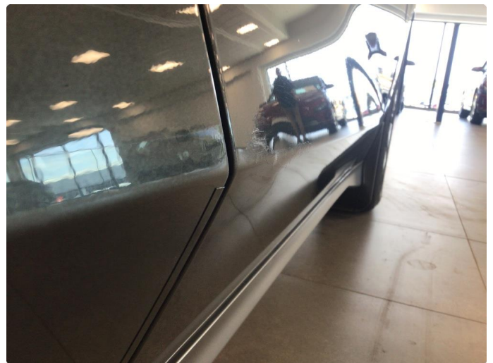
2.1 Noe overfladiske riper på høyre side av bil, samt noen p-bulker