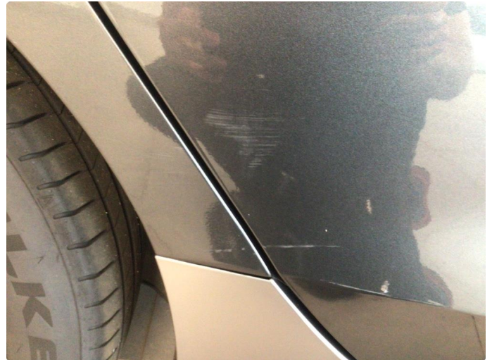
2.1 Noe overfladiske riper på høyre side av bil, samt noen p-bulker