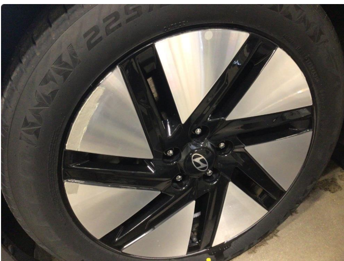
2.2 Kantkjørt en sommerfelg