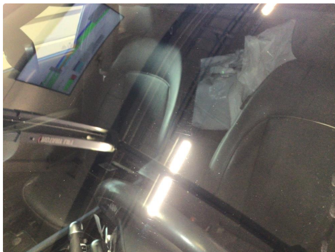
2.3 Noe steinsprut og slitasjeriper på frontvindu