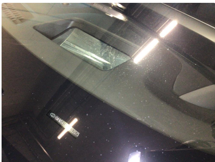
2.3 Noe steinsprut og slitasjeriper på frontvindu