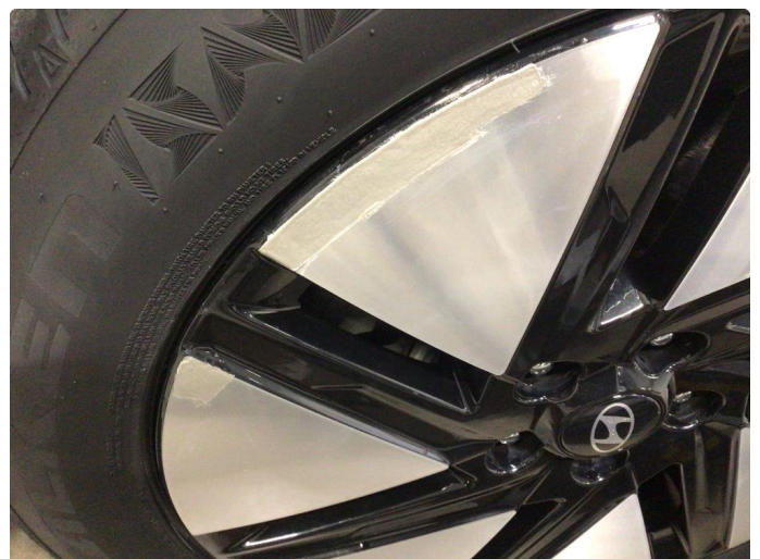
2.2 Kantkjørt en sommerfelg