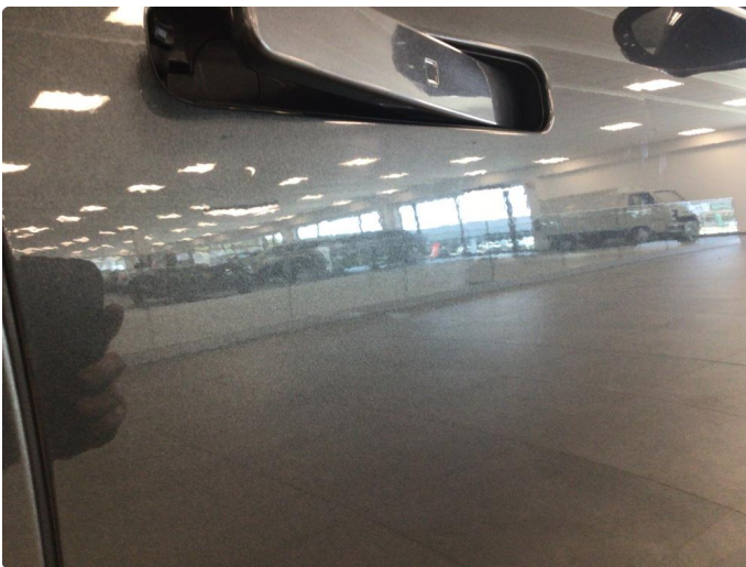
2.1 Noe overfladiske riper på høyre side av bil, samt noen p-bulker