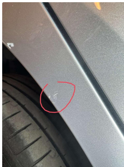
2.1 Ripe(r), blir utbedre før salg