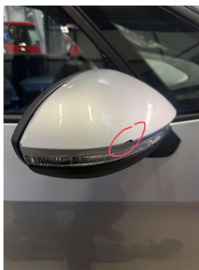
2.3 Liten ripe