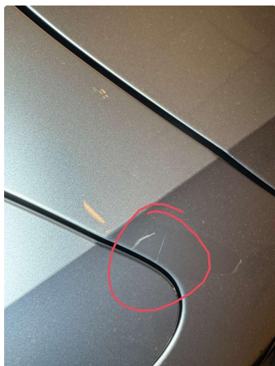
2.1 Ripe(r), blir utbedre før salg