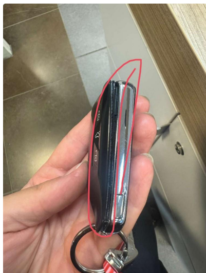
1.1 Løs gummi