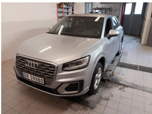
2.1 Div steinsprut og lakkriper finnes