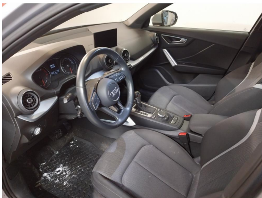
2.1 Div steinsprut og lakkriper finnes