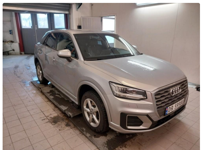
2.1 Div steinsprut og lakkriper finnes