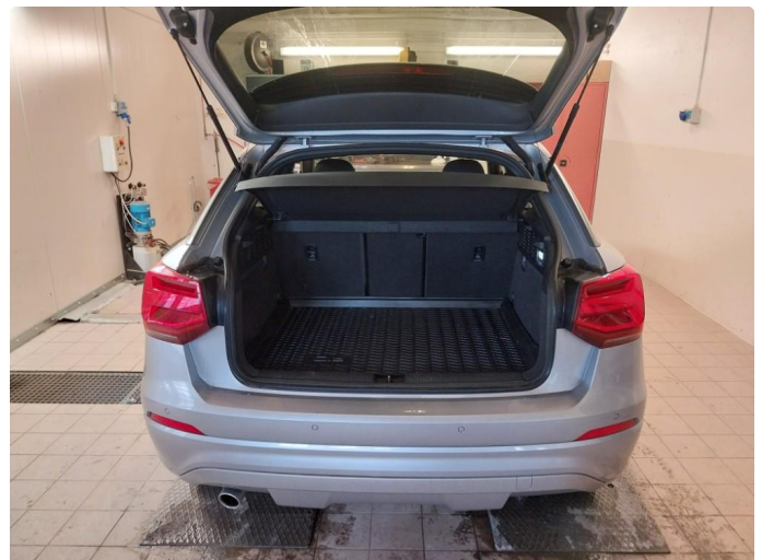
2.1 Div steinsprut og lakkriper finnes