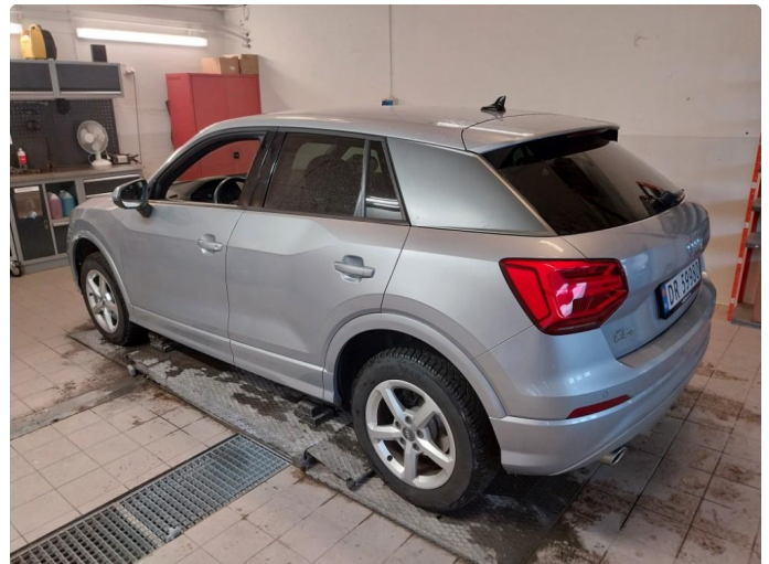
2.1 Div steinsprut og lakkriper finnes