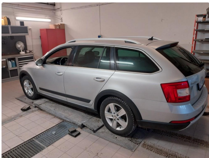
2.1 Div steinsprut med korrosjon og lakkriper finnes