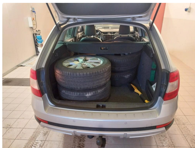
2.1 Div steinsprut med korrosjon og lakkriper finnes