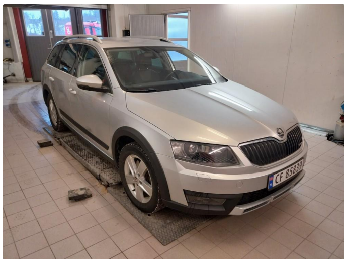
2.1 Div steinsprut med korrosjon og lakkriper finnes