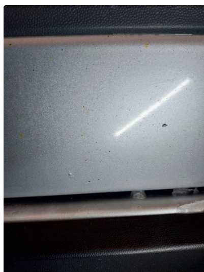
1.1 Steinsprut med rust