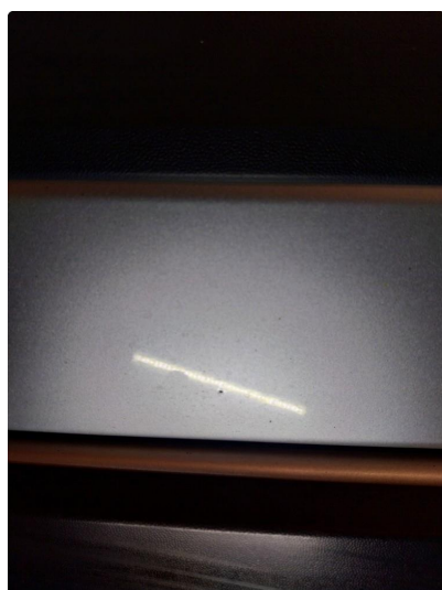
1.2 Steinsprut med rust