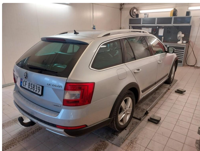
2.1 Div steinsprut med korrosjon og lakkriper finnes