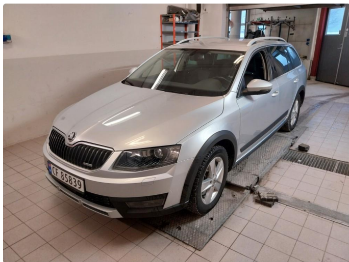
2.1 Div steinsprut med korrosjon og lakkriper finnes