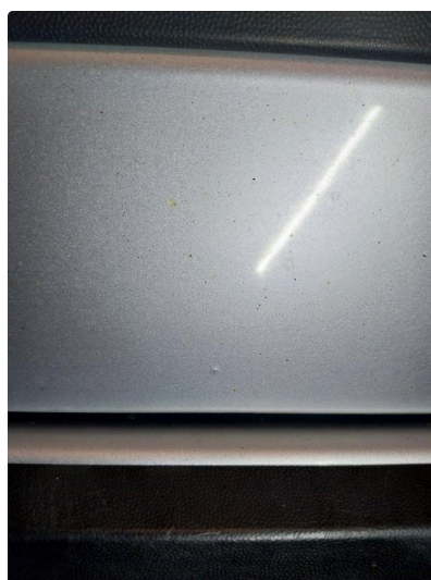
1.1 Steinsprut med rust