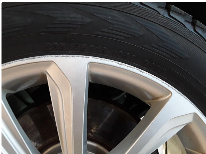
1.2 Noe kantkjørt vinterfelg.