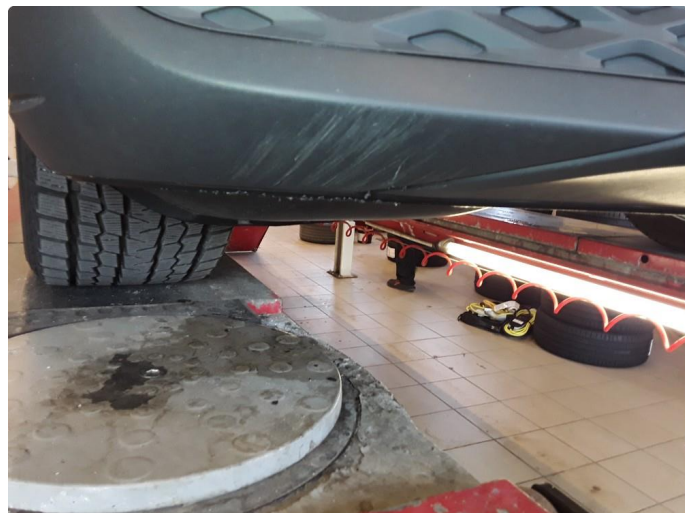
1.3 Noe riper i underkant.