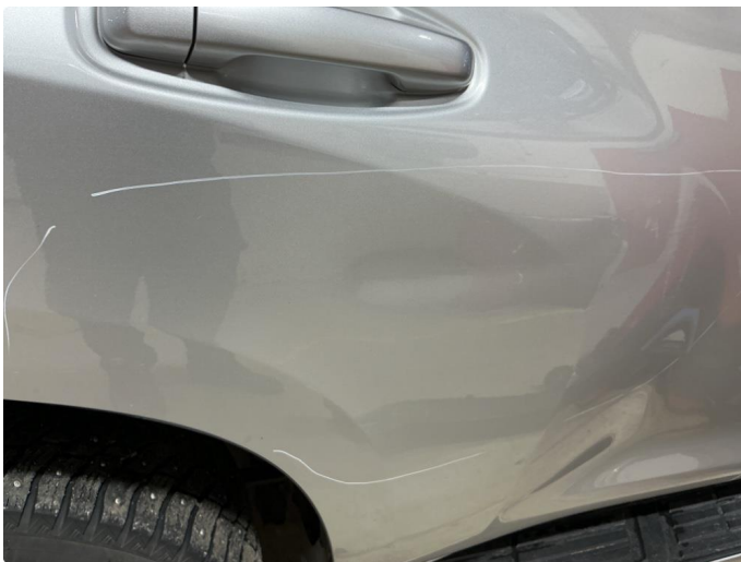
2.2 Bulk (stor) i høyre bakdør rettes pris kr. 5000 eks mva