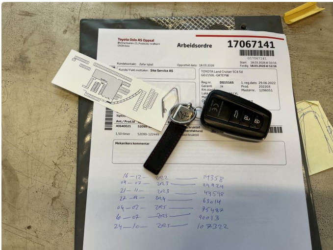
1.1 Mangler 1 stk nøkkel, komplett nøkkel pris kr 13 726,- ink mva