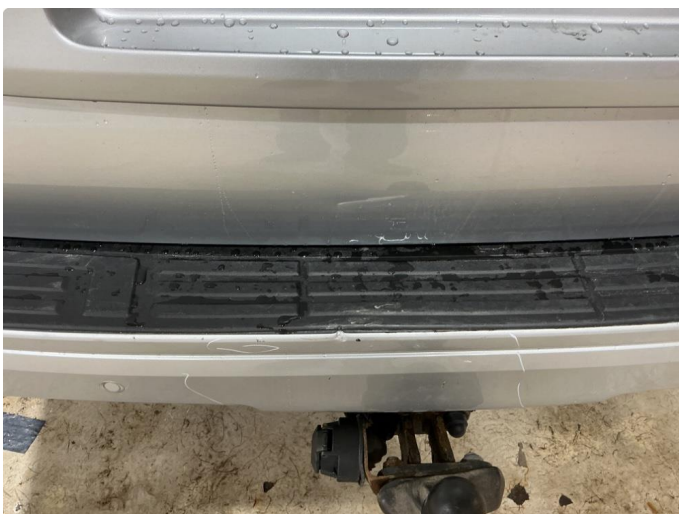
2.3 Lakkskade bakfanger midtre del + skifte sort plate pris kr.18 000,- eks mva.