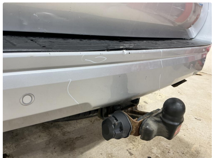
2.3 Lakkskade bakfanger midtre del + skifte sort plate pris kr.18 000,- eks mva.