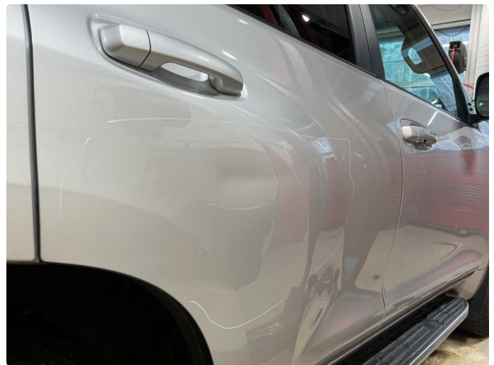
2.2 Bulk (stor) i høyre bakdør rettes pris kr. 5000 eks mva