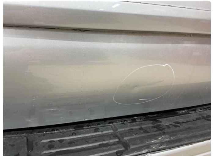
2.1 Bulk på bakluke. rettes pris kr.3000 eks mva.