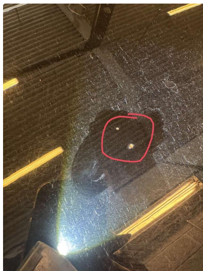
1.1 Noe steinsprut , blir utbedret før salg