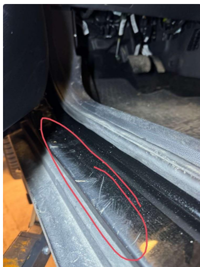
1.2 Riper, blir utebdret før salg