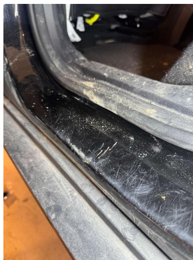
1.2 Riper, blir utebdret før salg