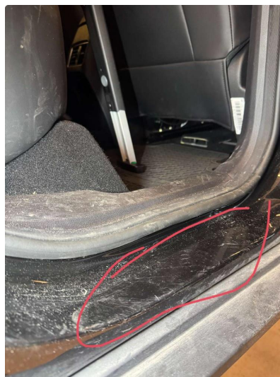
1.2 Riper, blir utebdret før salg