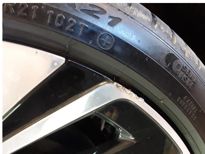
1.5 Noe kantkjørt sommerfelg.