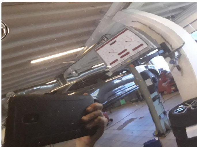
1.2 Liten bulk. Blir forsøkt med bulkfix.