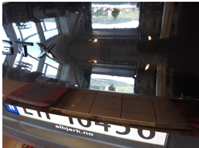
1.3 Steinsprut med korrosjon.