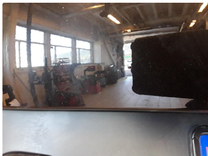
1.3 Steinsprut med korrosjon.