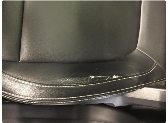
2.1 Skade på setepute