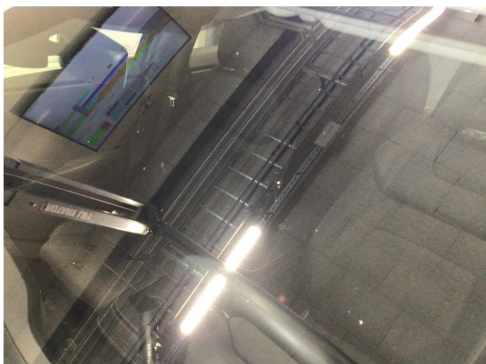
1.2 Noe steinsprut på frontvindu, en knast er limt