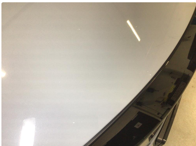
1.1 Noe steinsprut på panser