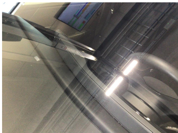
1.2 Noe steinsprut på frontvindu, en knast er limt