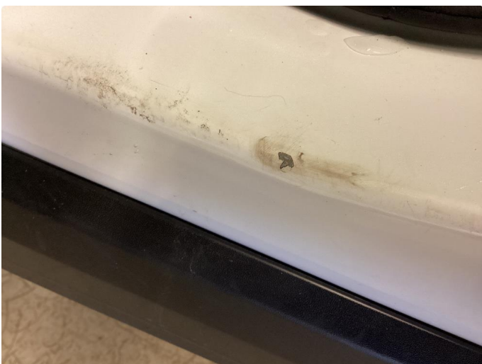
1.3 Slitt innsteg