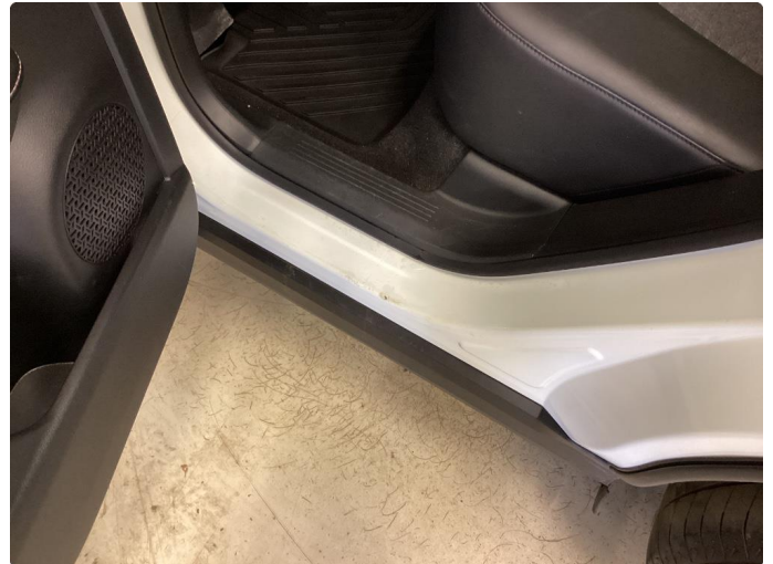
1.3 Slitt innsteg