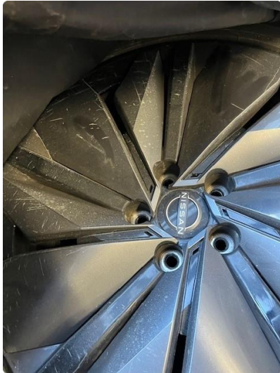
1.1 Riper hjulkapsel