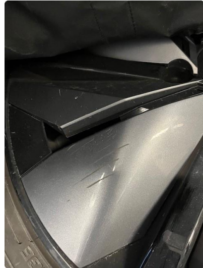
1.2 Riper hjulkapsel