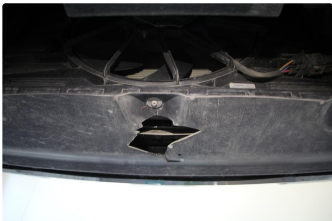
1.2 Beskyttelsesplate skadet