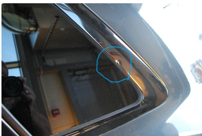
1.4 Liten bulk i list.