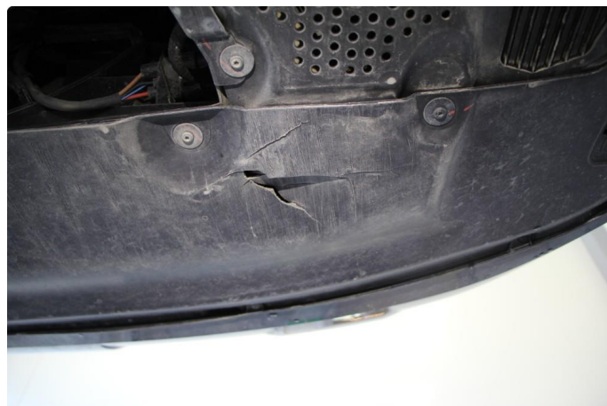
1.2 Beskyttelsesplate skadet