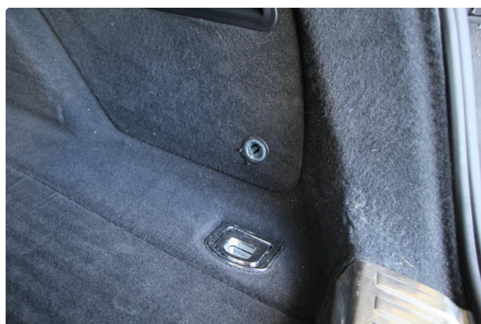
2.1 Lokk for 12 v uttak i bagasjerom er brukket av .