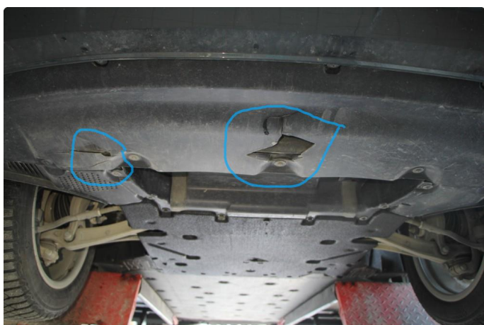
1.2 Beskyttelsesplate skadet