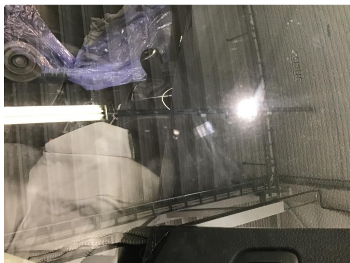
1.2 Noe steinsprut på rute (ikke sprekk)