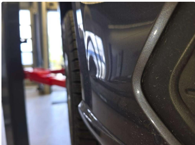
1.1 Noe små riper på fram + bakfanger h.s.