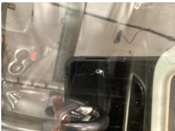
1.3 Steinsprut med sprekk utenfor synsfelt