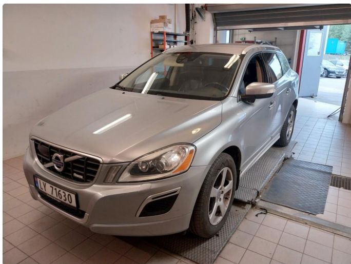
4.1 Øvrig opplysninger