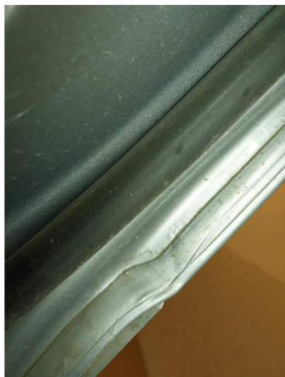
2.2 Korrosjon i fals