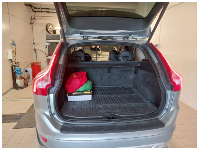
4.1 Øvrig opplysninger