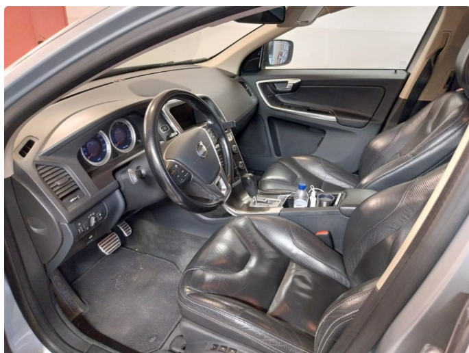
4.1 Øvrig opplysninger