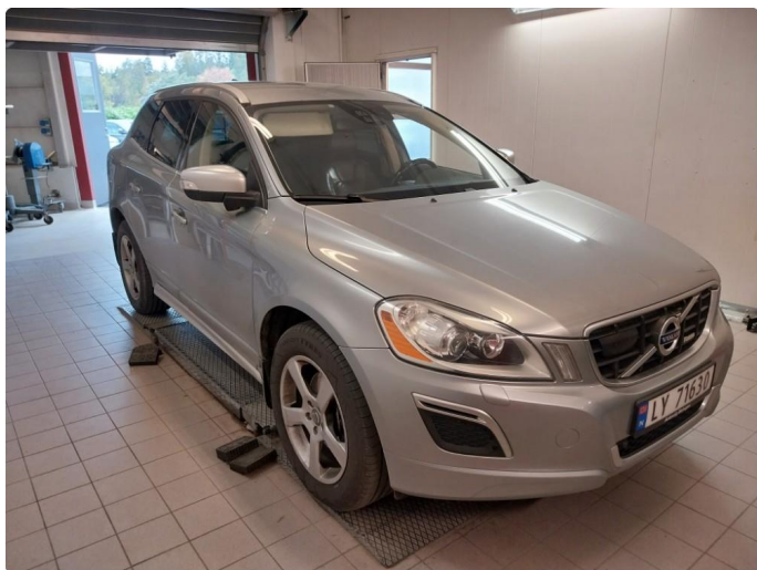
4.1 Øvrig opplysninger