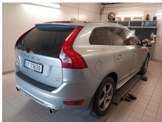
4.1 Øvrig opplysninger