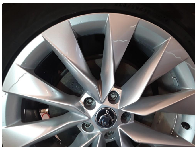
1.4 Noe kantkjørt vinterfelg.