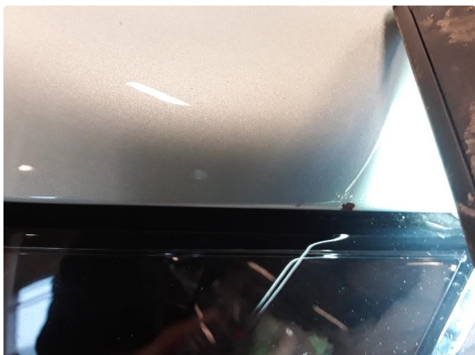
1.2 Noe steinsprut med korrosjon.