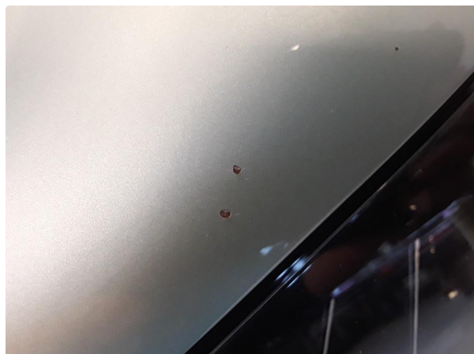
1.2 Noe steinsprut med korrosjon.