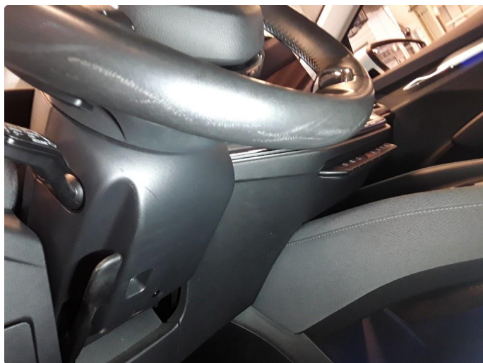
2.1 Noe sår.