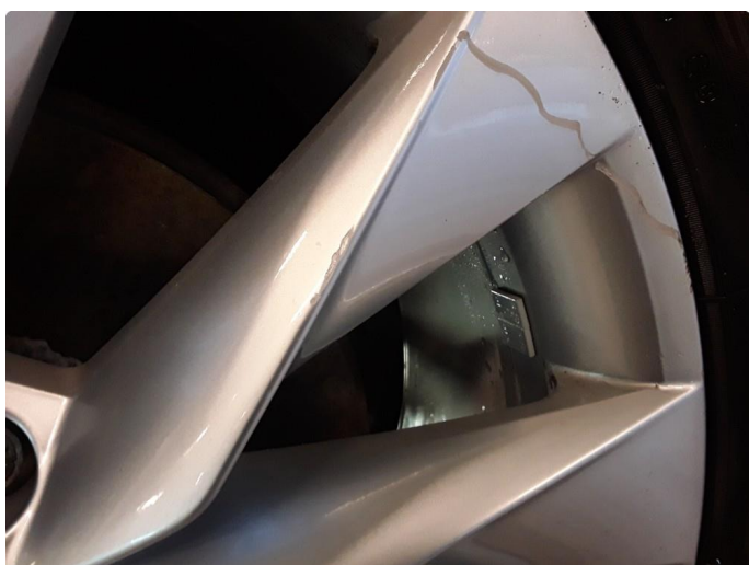
1.4 Noe kantkjørt vinterfelg.