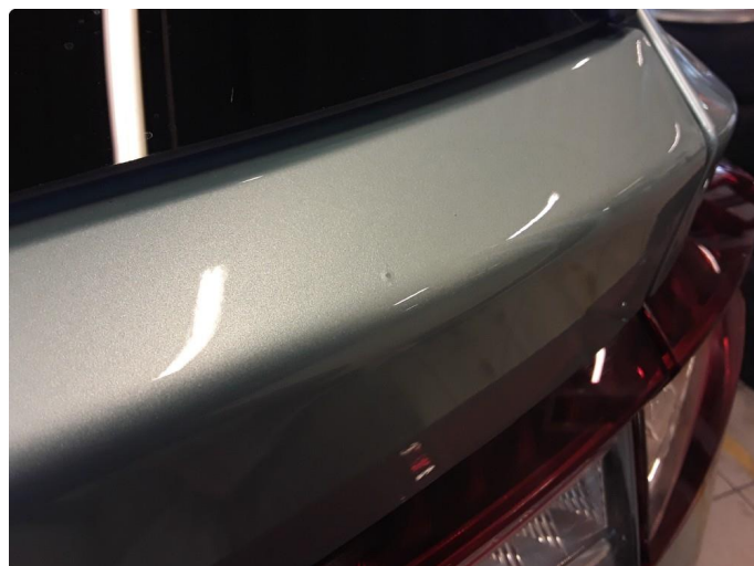
1.3 Liten steinsprut med korrosjon.