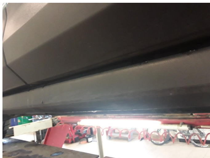
1.4 Noe riper høyre kanaldeksel.