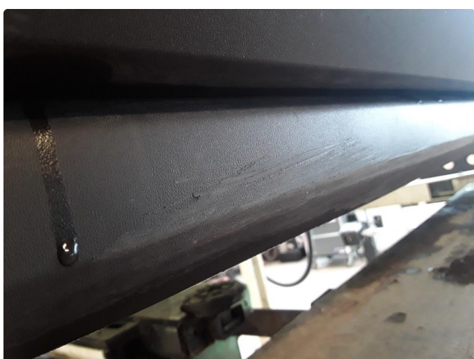
1.4 Noe riper høyre kanaldeksel.