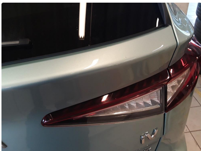
1.3 Liten steinsprut med korrosjon.