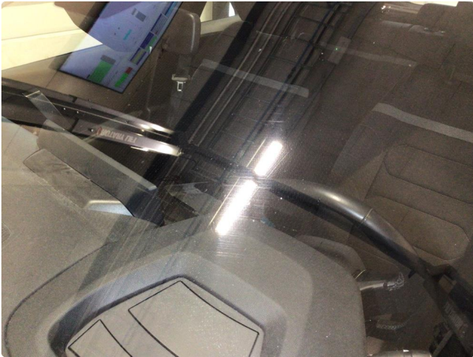
1.1 Litt slitasjeriper i frontrute, anses som normal slitasje