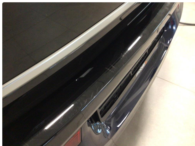
1.1 Noe overfladiske riper/merker i lakk, dette blir å regne som normal bruksslitasje