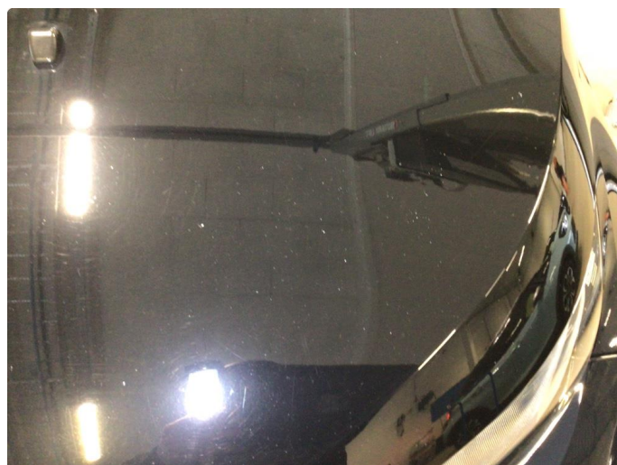
1.2 Steinsprut på panser