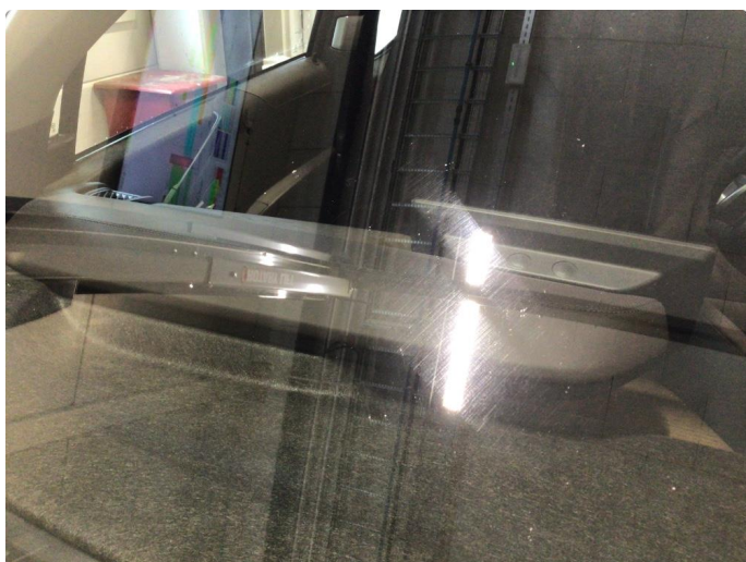
1.4 Noe steinsprut på frontvindu