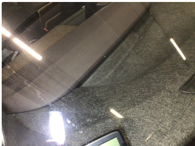
1.4 Noe steinsprut på frontvindu