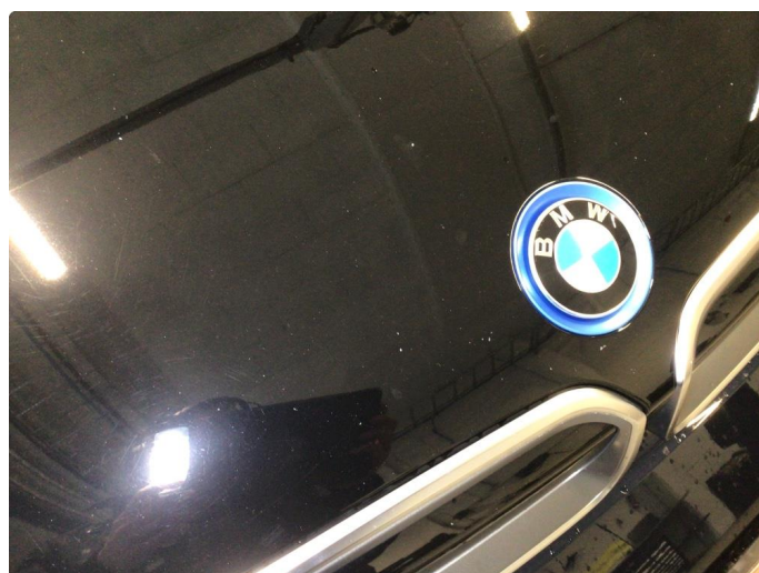
1.2 Steinsprut på panser