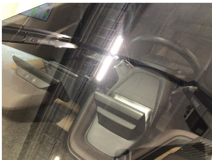
1.4 Noe steinsprut på frontvindu