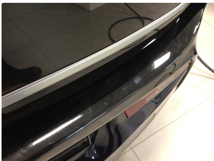
1.1 Noe overfladiske riper/merker i lakk, dette blir å regne som normal bruksslitasje