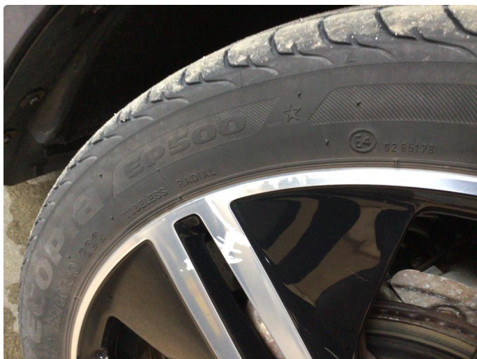
1.3 Kantkjørt en sommerfelg