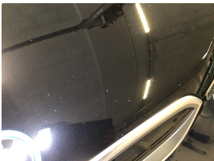
1.2 Steinsprut på panser