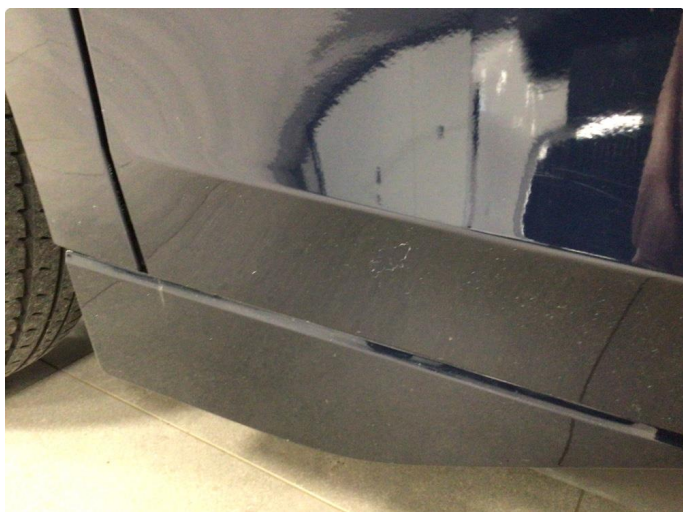
1.1 Noe overfladiske riper/merker i lakk, dette blir å regne som normal bruksslitasje