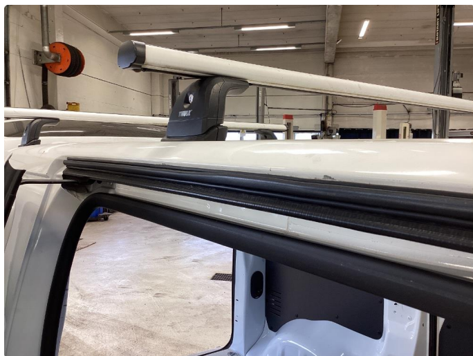
1.4 Lakk flass