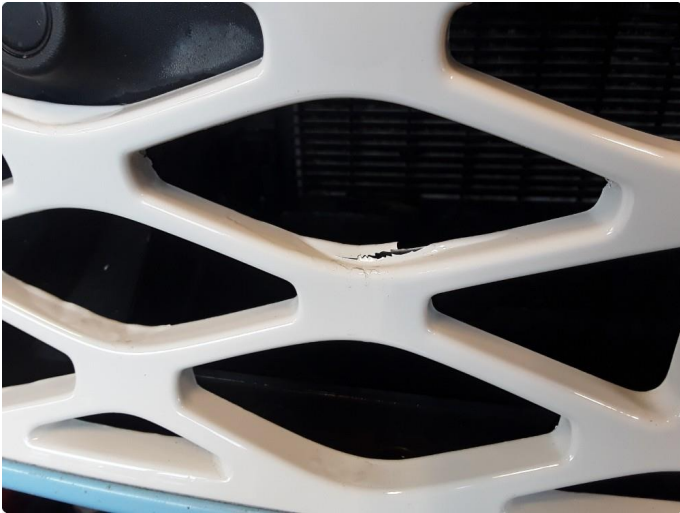
1.2 Grill i støtfanger foran er omlakkert.