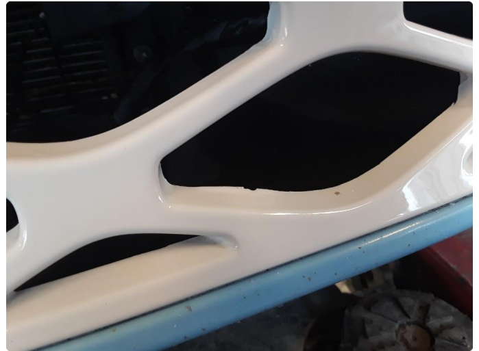
1.2 Grill i støtfanger foran er omlakkert.