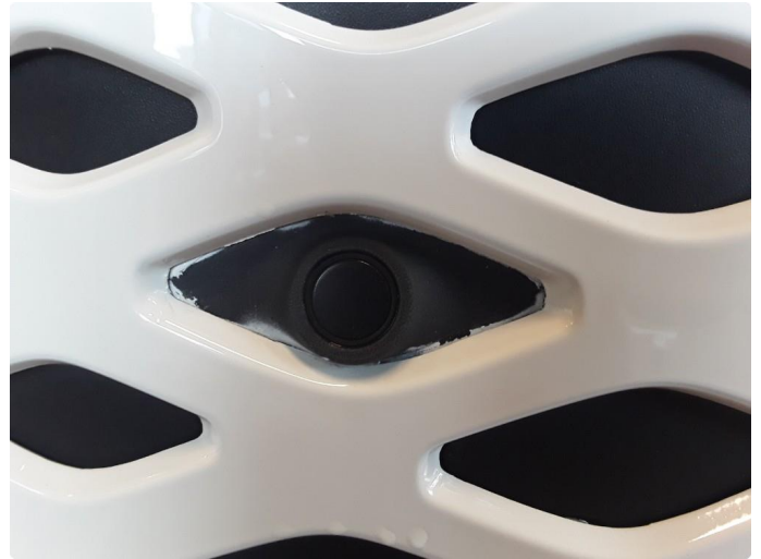
1.2 Grill i støtfanger foran er omlakkert.