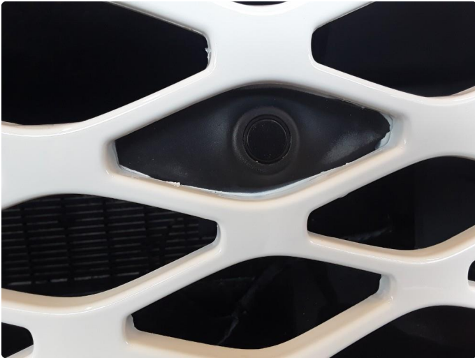
1.2 Grill i støtfanger foran er omlakkert.