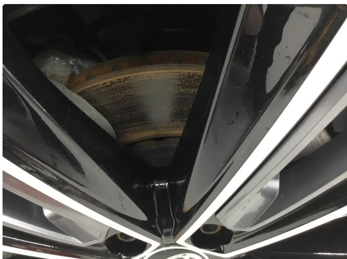
1.1 Overflaterust på bremseskiver. KJØRES RENE NÅR BILEN TAS I BRUK.