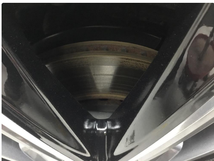
1.1 Overflaterust på bremseskiver. KJØRES RENE NÅR BILEN TAS I BRUK.