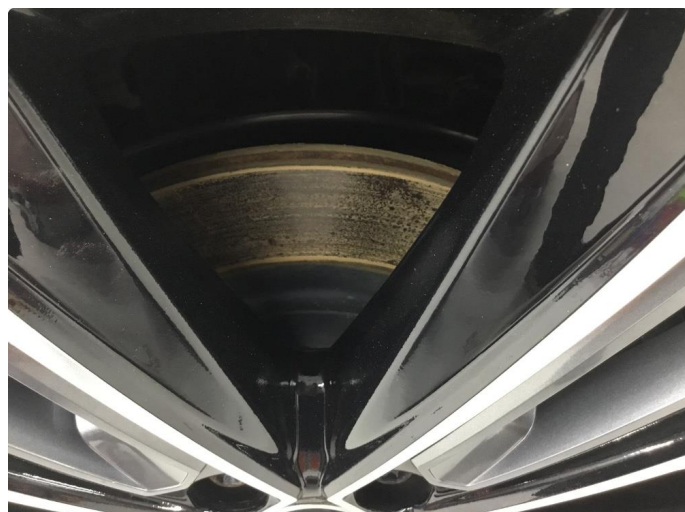
1.1 Overflaterust på bremseskiver. KJØRES RENE NÅR BILEN TAS I BRUK.