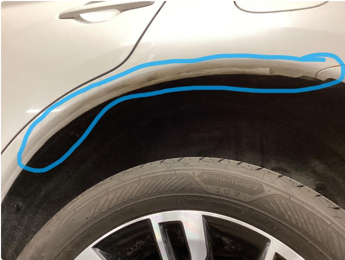
1.1 Ufagmessig utført arbeid