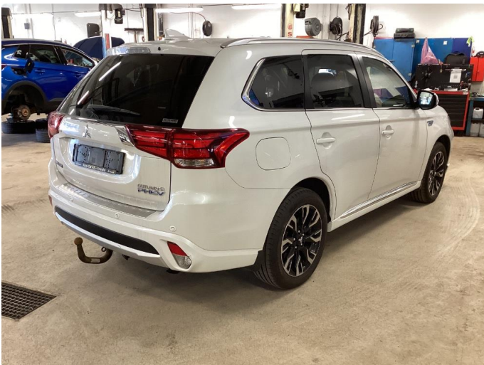
2.2 Øvrig opplysninger