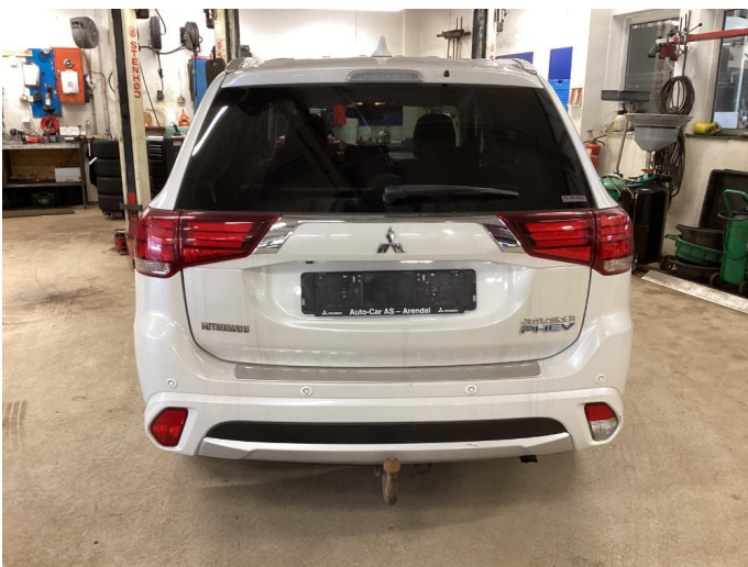
2.2 Øvrig opplysninger