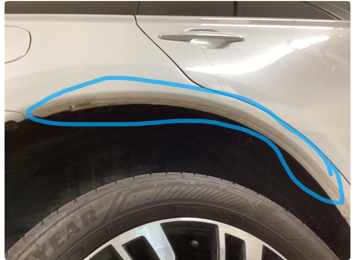
1.2 Ufagmessig utført arbeid