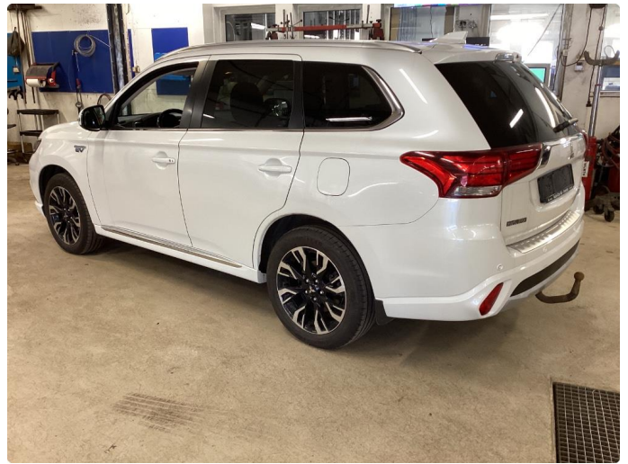
2.2 Øvrig opplysninger