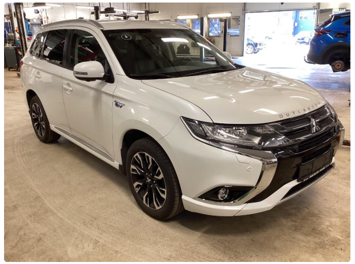
2.2 Øvrig opplysninger