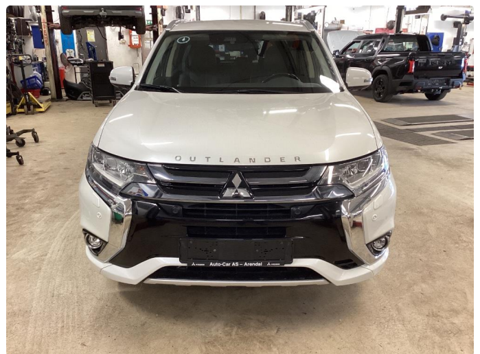
2.2 Øvrig opplysninger