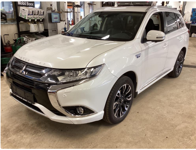
2.2 Øvrig opplysninger