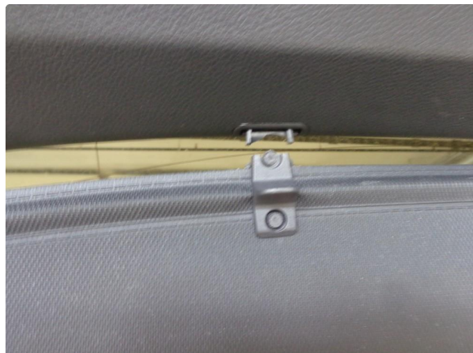
2.1 Skadet. NY MONTERES.