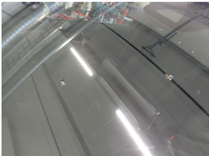
1.2 Steinsprut utenfor synsfelt. RUTE BYTTES HOS RIIS BILGLASS.