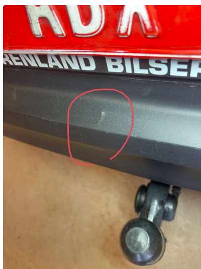
1.3 Liten bulk