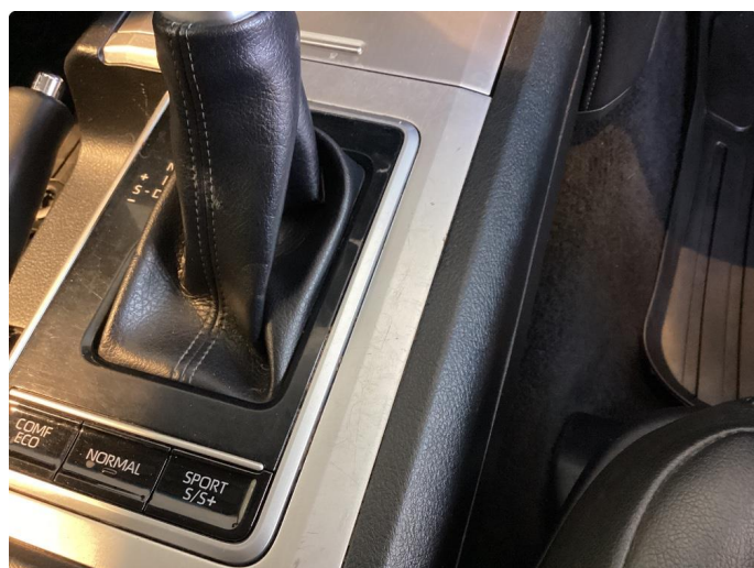
2.1 Riper midtkonsoll