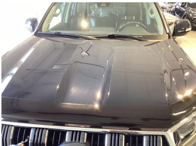
1.1 Steinsprut panser