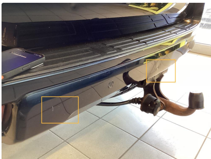
1.3 Skade, riper