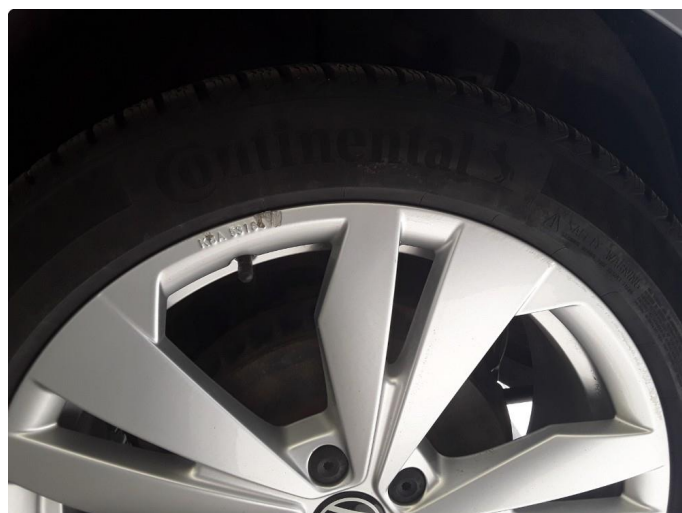
1.2 En vinterfelg litt kantkjørt.