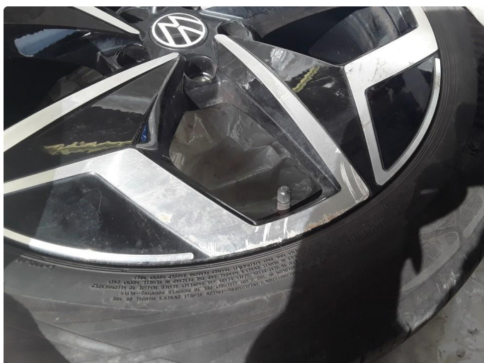
1.1 To sommerfelger litt kantkjørt.