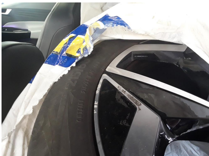
1.1 To sommerfelger litt kantkjørt.