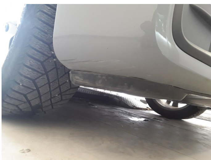
1.3 Riper underkant støtfanger foran høyere side.