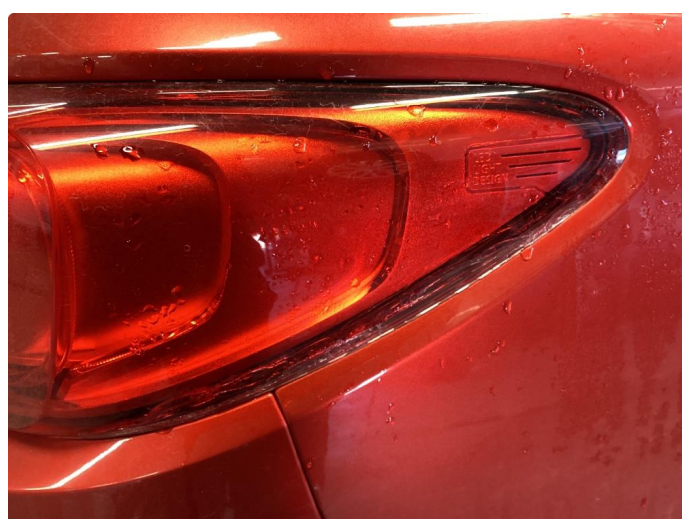
2.1 Krakelering i plast