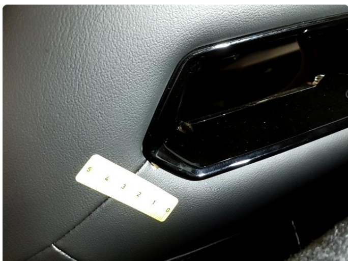
2.1 Skade på seterygg