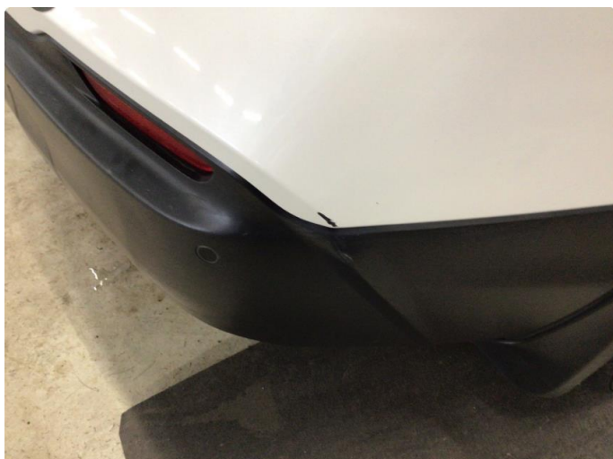
1.1 Lite skrap