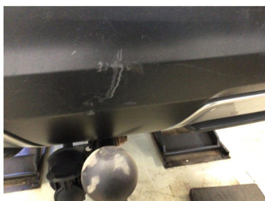
1.6 Skrap i ulakkert del