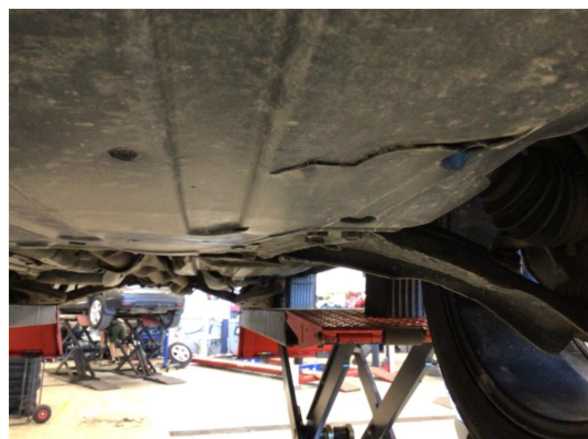
1.3 Sprekk/knekk i plastdeksel under bil