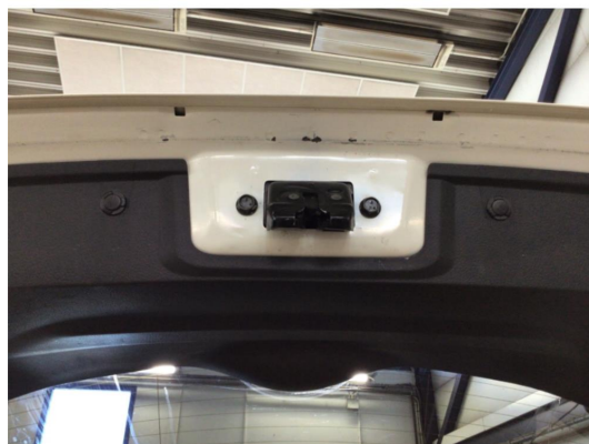
1.4 Skrap i lakk på inside av bakluke