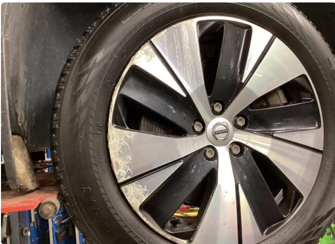
1.3 Noe kantsår og oksidering