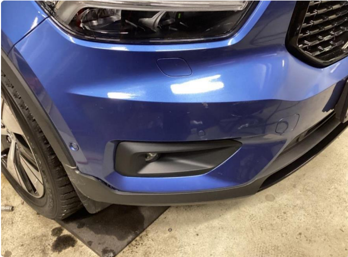
1.1 Små skrap