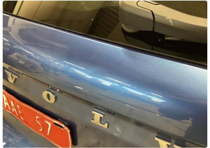
1.2 Liten bulk