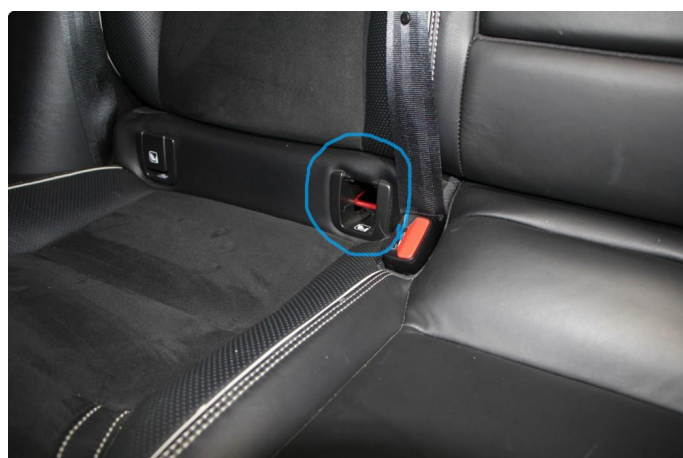
2.1 Mangler deksel over ISOfixfeste