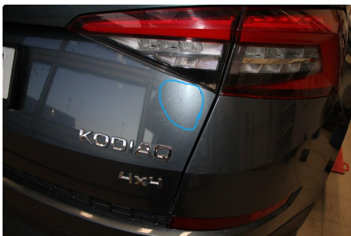
1.4 Ripe(r) ned til grunning