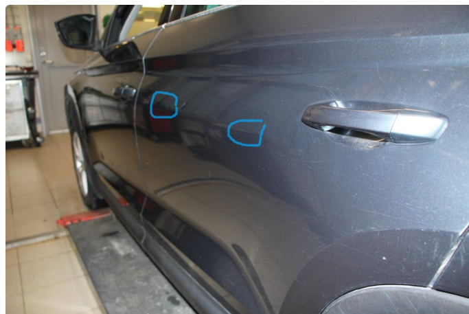
1.3 Flere p-bulker