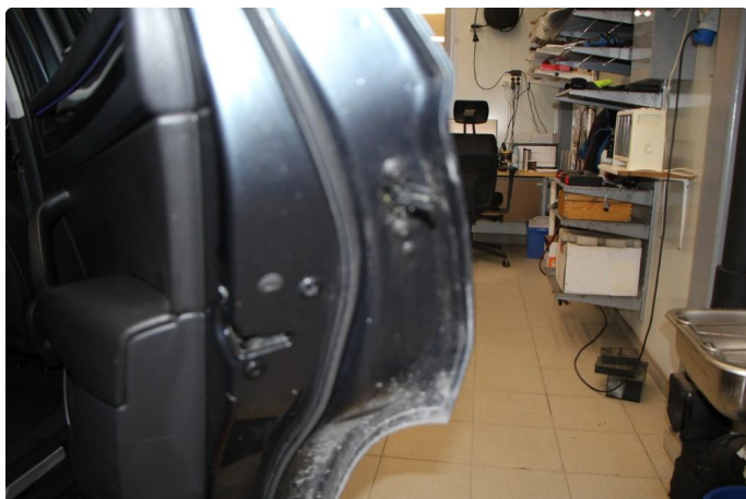
1.2 Det mangler dørkantbeskyttelse på begge dører bak.