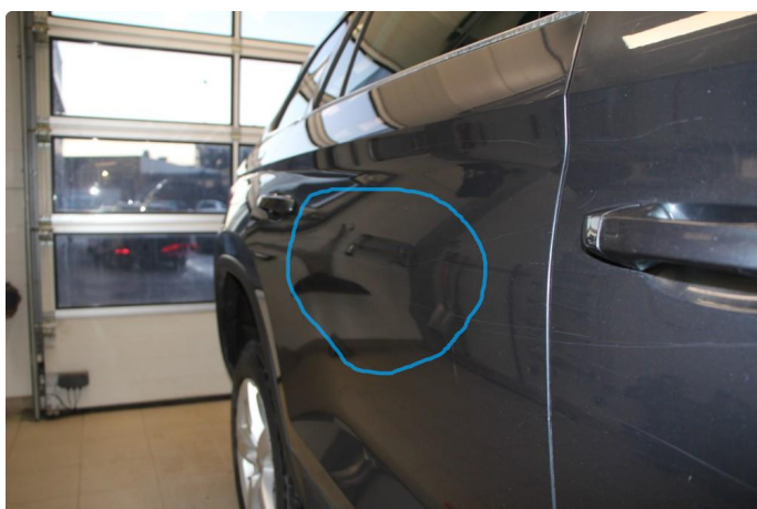
1.3 Flere p-bulker