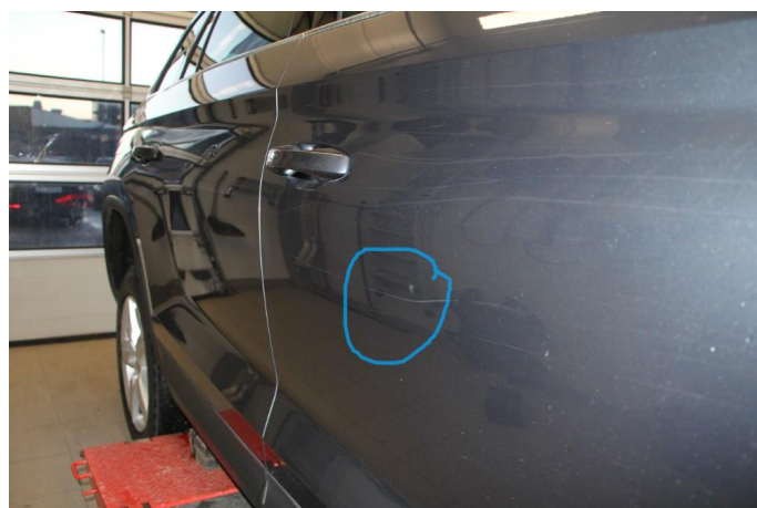
1.3 Flere p-bulker